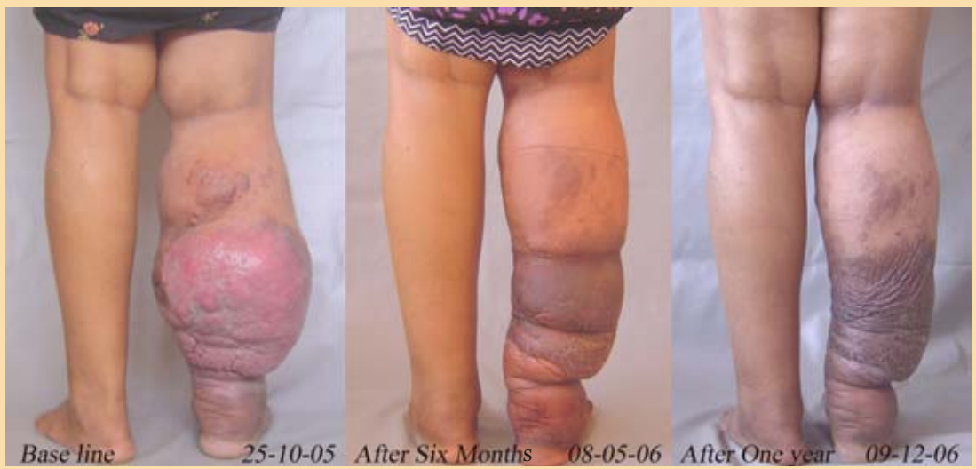
Base line 25-10-05 After Six Months 08-05-06 After One year 09-12-06