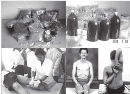
ആയുർവേദ മരുന്നും സ്വയം സഹായ ചികിത്സാ മുറികളും

ഫൈലേറിയോസിസ് (മന്ദ്) / ലിംഫഡിമ, വെള്ളപ്പാണ്ട്, സോറിയാസിസ്, ലൈക്കംപ്ലാനസ്, വൃണ ചികിത്സ എന്നിങ്ങനെ സമൂഹത്തിൽ നിന്നും അവഗണിക്കപ്പെടുന്ന തൃക്ക് രോഗക്കാൽക്ക് വേണ്ടി അലോപ്പതി, ആയുർവേദം, ഹോമിയോപ്പതി, യോഗ എന്നിങ്ങനെയുള്ള പാരമ്പര്യ ചികിത്സാ രീതികൾ സംയോജിപ്പിച്ചുകൊണ്ടുള്ള ചികിത്സാ സമ്പ്രദായമാണ് ഇവിടെ ഉപയോഗിച്ചുവരുന്നത്. ഭാരതത്തിന്റെ പരമ്പരാഗത ആശയമായ ഗൃഹോപചാര (സ്വയംസഹായ ചികിത്സ) എന്നതാണ് സംയോജിത ചികിത്സയുടെ മുഖ്യ ആശയം ആയതിനാൽ സംയോജിത ചികിത്സരീതി രോഗികളെയും കുടുംബാംഗങ്ങളെയും പരിശീലിപ്പിച്ച് വീട്ടിൽ സ്വയം ചെയ്യാനായി പ്രാപ്തരാക്കുന്നു.